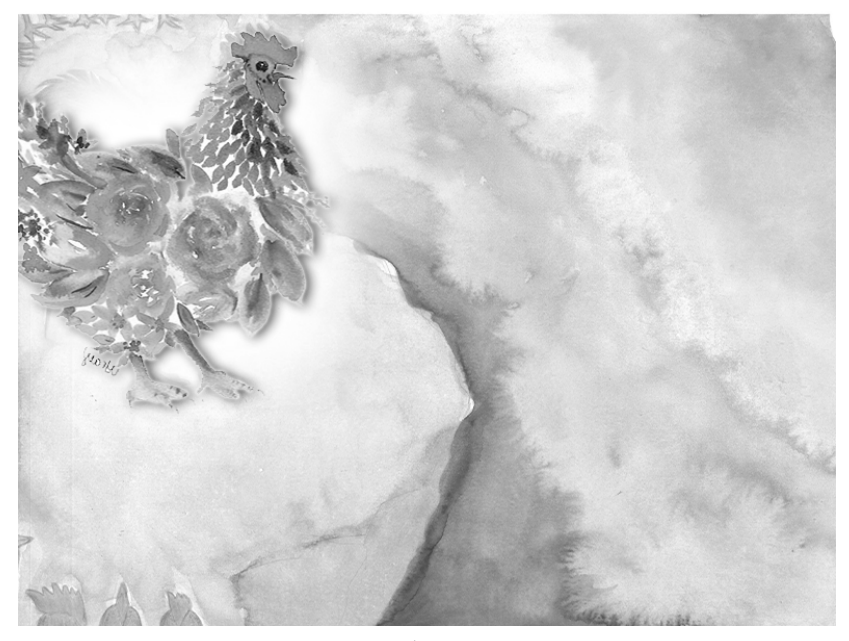
Cock Crows / 5D Mak Sum Yu

He became the most useful animal in the forest.