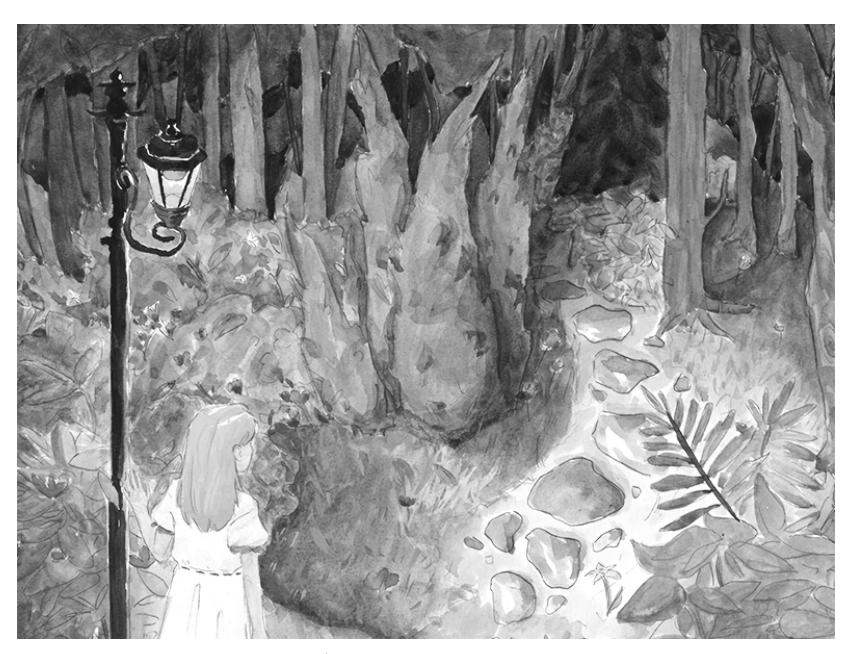
Exit / 3C Ikonen Charlotte Chole

At first, the prince was an idle youth. Later, we could see that he bravely saved the princess. The moral of the story is, "Don't be afraid of facing difficulties. Anything in the world may happen. Never give up!"