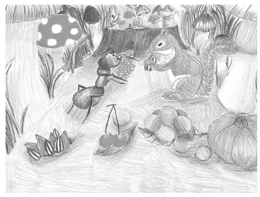
Sharing / 4A Tang Nok Sze