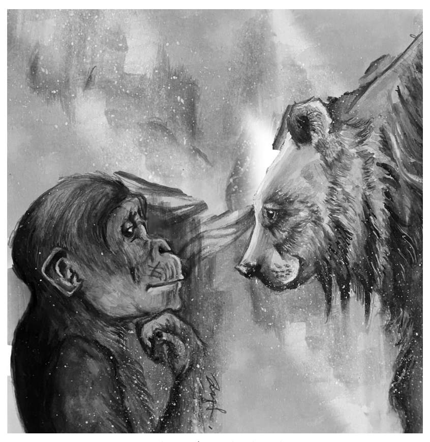
Soulmate / 3D Luk Wing Yin