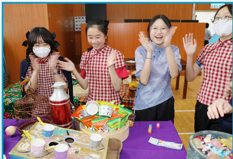
同學落力招客競逐我最喜愛攤位

在短片製作的過程，我們的團隊不斷改善和進步，令短片更加優質！同學間的不離不棄和互相鼓勵，令我們獲得優良的成績。在分工合作當中，我體會到每個人總有他的位置和角色，要信任團隊和鼓勵隊員，成果就會更完美。「文化行程設計比賽」加強了我對本土歷史風俗文化的認識和欣賞。