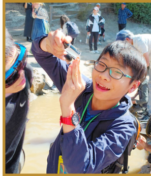
Finding bits of gold in the river