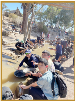
Gold Panning at the Sovereign Hill