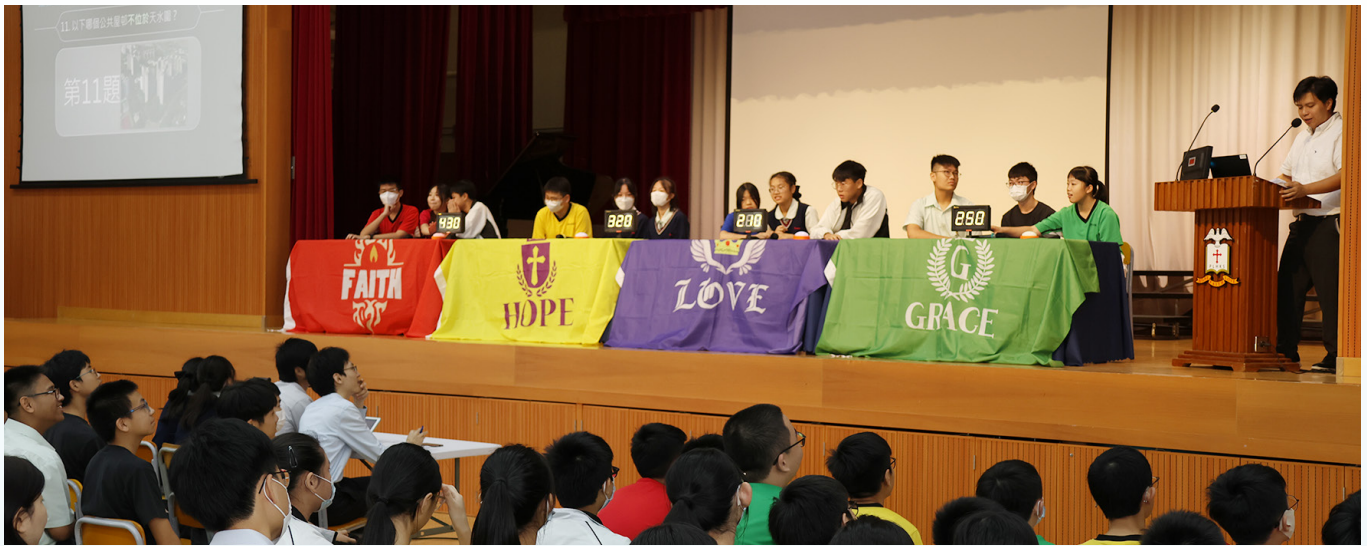
文化問答比賽四社爭持激烈