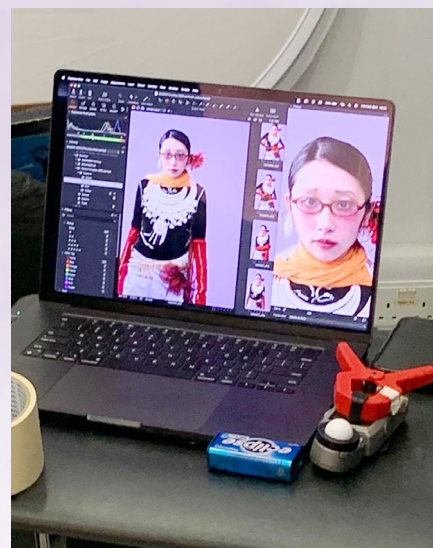
專業模特兒穿上由同學親自設計的時裝成品，並進行拍攝