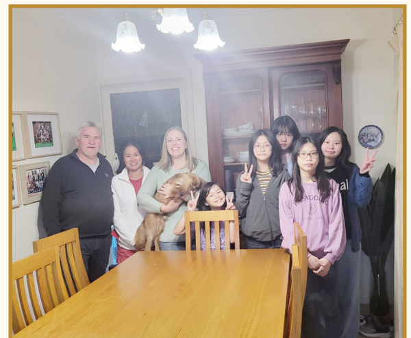
Staying at a host family

My homestay is located in Hoppers Crossing. There are a couple, a 4-year-old daughter and a Rottweiler dog called Lues. I have learned about the living habits of Australians from my host family. I found out that they usually wake up early because the commuting time is long, which is different from Hong Kong.