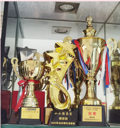
古箏比賽獎盃舉隅