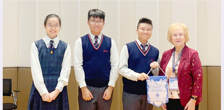
Championship in the Public Speaking Team Open in the 75th HK Schools English Speech Festival