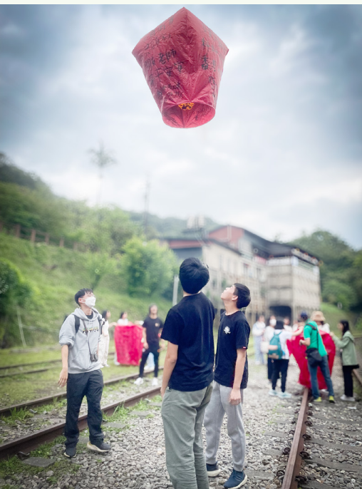
天燈上升的一刻，大家都期盼著自己的願望能成真

除了欣賞各種景致，品嚐當地特色美食也是這次旅程的重要部分！我們造訪了著名的饒河街夜市，那裡琳瑯滿目的小吃攤位，有胡椒餅、蚵仔煎、炸雞排等等，應有盡有。另外，當然不少得當地的正宗滷肉飯和經典牛肉麵！美味非常！我們一桌八人竟然共吃了十九碗滷肉飯，可見其美味程度。此外，我們還嘗試了刺激有趣的攤位遊戲，如射氣球等，增添了不少樂趣。