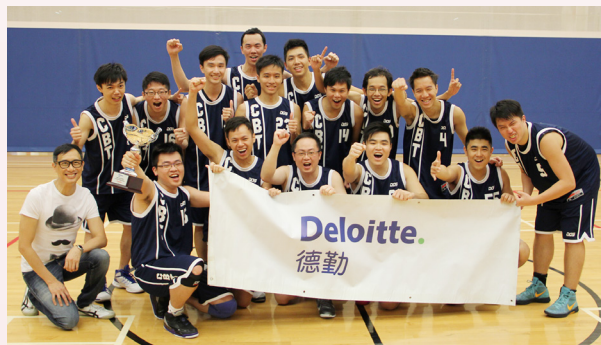
懷念昔日籃球隊隊的時光

由中一陸運會在看台上為社員加油打氣，到為望社爭取陸運會佳績，陳校友在望社的點滴亦歷歷在目。望社獲得陸運會全場總冠軍，是中學生涯中最令他回味的事。