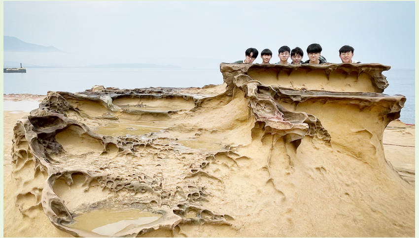
野柳地質公園內滿佈各種千奇百趣的石頭

通過親身探索，我對這個世界有了更深的認識和理解。參觀野柳地質公園時，我對大自然神奇的力量感到敬畏，原來經過漫長的時間，大自然可以締造出如此奇特的地質景觀。此外，我也十分欣賞台灣在保育政策上的成就，他們不僅積極推動保育措施，更善用獨特資源來吸引遊客，並藉此宣揚環保理念。