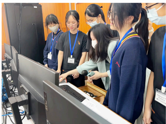
老師指導同學使用舞台系統

校 園電視台的日常工作包括早上在樓層巡邏，確保各班能接收直播；在校園電視台室準備有關設備和軟件，與當天負責宣佈的老師和同學溝通；在禮堂後台工作，控制燈光、音響、投影機、播放國歌等，讓升旗禮和早會分享順利舉行。一年下來，我們積極投入校園電視台的活動中，勇敢面對不同挑戰，在團隊中發揮自己的才幹。