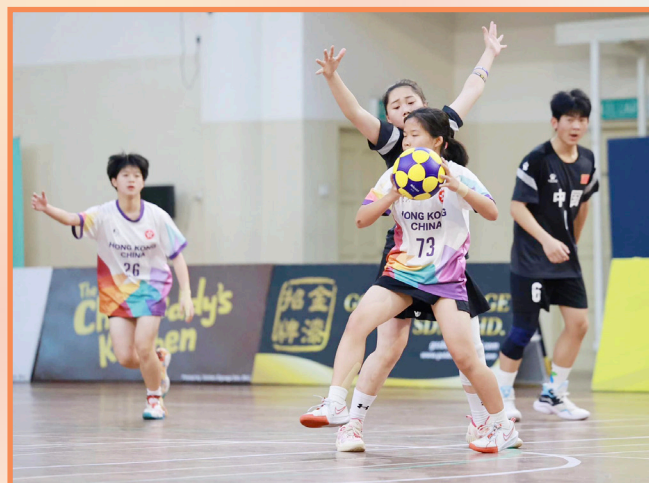
除了技術，各隊員的配合十分重要

代表香港出國參加合球比賽，讓我見識到其他國家參賽者的實力。我們身高上沒有任何優勢，經驗上也沒有別人豐富，但我們沒有因此放棄，而是用不同方法想對策，去打好每一場比賽。由於這是我第一次參賽，無論是技術上，還是策略或體能上，還有很多需要學習進步的地方。我認為這是一次很好的機會，讓我增值自己和擴闊眼界，我將會更加努力、認真練習，希望自己能在各方面有所提升，在下次比賽中勝過上一次的自己。