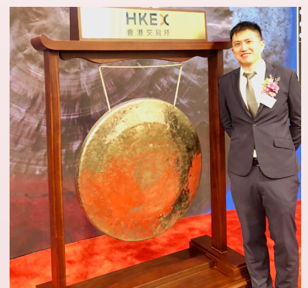
與合伙人開設了會計師事務所

並且堅持努力實踐。就如龜兔賽跑的故事一樣，人生很長，有很多變數，現在盡力去做，若有些事情不是我們能夠控制的，那就交給上帝。