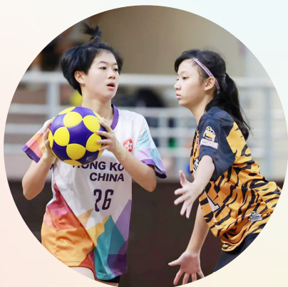
出戰吉隆坡馬來西亞2024IKF 亞洲合球錦標賽

“我明白到「實力」並非只有天賦，而是通過每一次的訓練鞏固而成，也許在訓練當中付出100%的努力，只能得到少少的收穫，也不會白費了我們的汗水。”