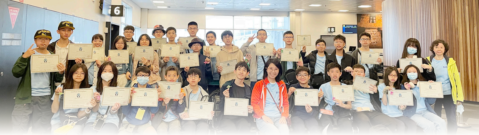
Receiving a certificate of participation