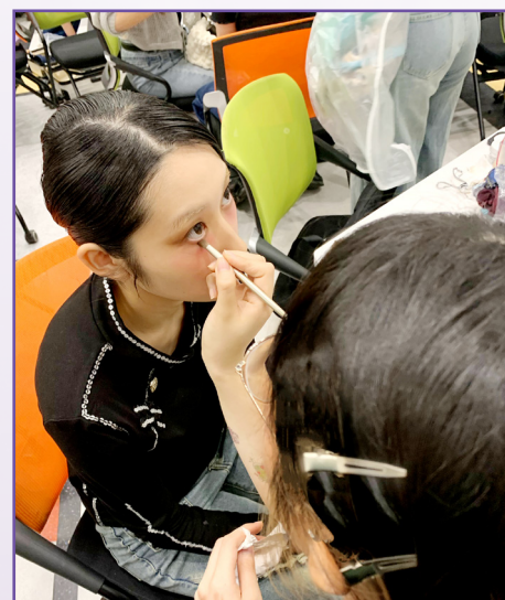
匯演當日透過化妝加強舞台效果

今年初在偶然的機會下，我參加了香港理工大學主辦的「賞藝縫裳」時裝設計比賽。由於參加者眾多，我本來亦只是志在參與，挑戰自我。當收到入圍通知時，興奮是必然的，但並沒有如想像中那般驚訝，我對自己的創作原來比我想像中有信心。有幸入圍，讓我體驗到許多第一次。這是一個「從無變有」的過程：從尋找模特兒、去理工大學學習服裝剪裁工藝知識、買材料、前往理工大學的時裝及紡織學院工作室製作成品、攝影，到最終的匯演，讓我有機會從頭到尾感受時裝設計師的工作，實在是非常寶貴的機會。很感謝老師與導師給予我協助與支持，讓我能充分的發揮藝術、感受藝術，並成為更傑出的藝術學生！