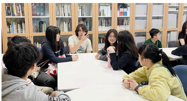
Interacting with Australian students in a group activity

Video produced by Lu Lok Ching (3A) and Lau Lut Hei (3C)