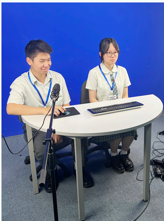
在播放前作最後的調整

“校園電視台不僅讓我深刻體會團隊合作的意義，也讓我學會如何在團隊中發揮自己的價值。”