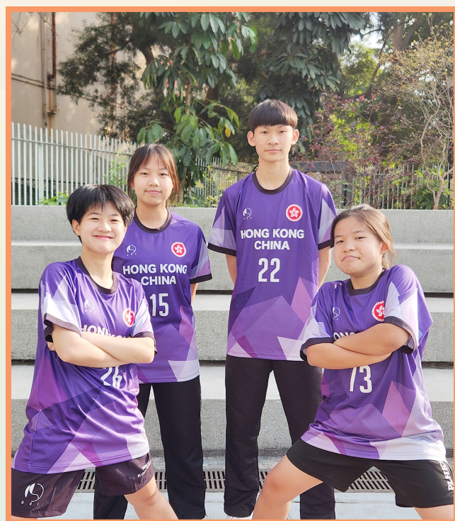
中國香港合球隊成員

這次比賽的經歷，讓我學會了處理失敗，以及珍惜機會。我將永遠以自己代表香港參賽的經歷為榮，並以此作為我人生中一個重要的里程碑。