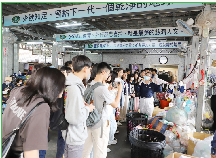
同學們在垃圾資源回收中心專心聆聽義工講解

今年交流團以台灣作為疫情後首個目的地。我們於復活節假期參加了5日4夜的交流團。透過參觀當地的地質公園、環保設施、老街及夜市，以及製作鳳梨酥和陶瓷DIY，我們能深入了解台灣的環境保育、文化歷史和日常生活的特色，使我們獲益良多。