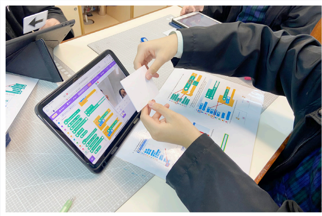
同學使用了Scratch遊戲設計編程創作迷宮

在創建迷宮大遊戲的過程中，我們學習了如何使用 Maze Generator 創作迷宮，並結合AI人工智能和Scratch遊戲設計編程，讓遊戲角色能夠通過語音指令走出迷宮。這個項目不僅鍛煉了我們的編程能力，更讓我們體會到人工智能技術的神奇之處。