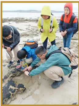
Finding traces of marine life