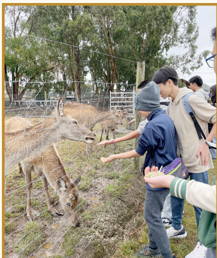
Feeding animals at Chesterfield Farm

I went to Sovereign Hill and got the opportunity to realize my dream – getting gold! I knelt down beside the river and started panning gold until I finally got the first bit of gold in my life. It was a minuscule amount but it still shimmers under the sun!