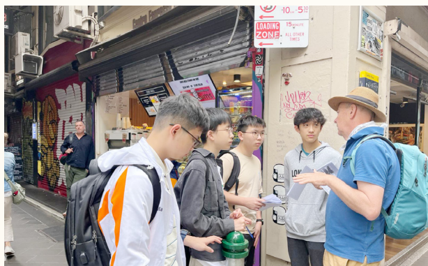
Exploring the city in the Amazing Race Activity