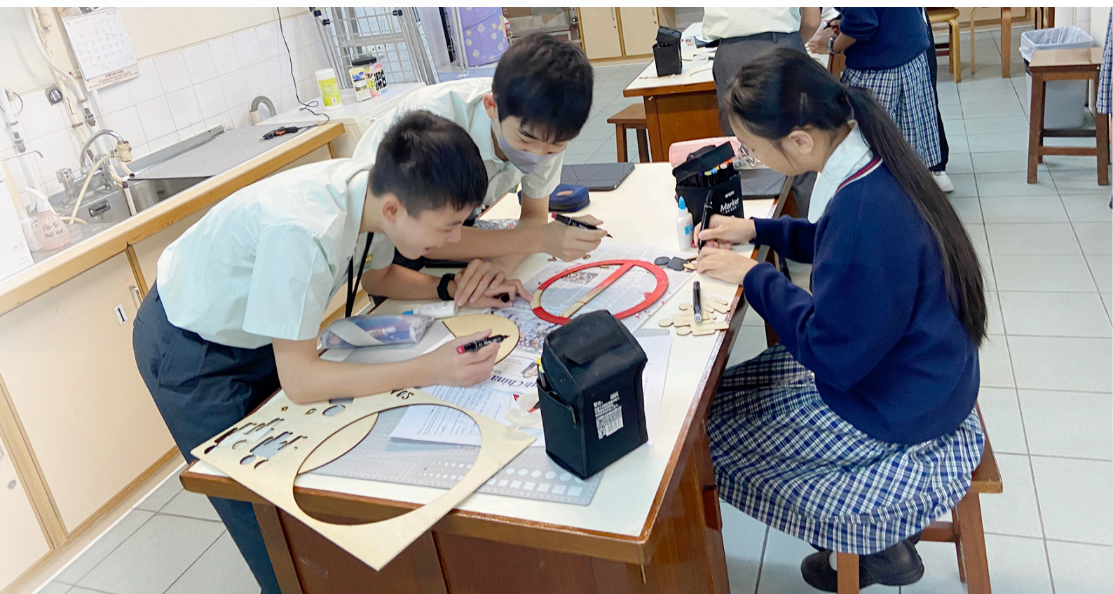
同學們十分享受一起設計告示牌的時間

我 校的STEAM課堂是同學們每周最期待的課堂之一。老師們通過各種策略精心設計了一系列趣味盎然的課堂，還加入了相關的生活議題，激發我們的學習動機。在課堂中，老師給予我們足夠的時間和空間去創想、討論和演說，讓我們經歷設計的過程，培養了我們的創意思維能力、解難能力和創新精神。