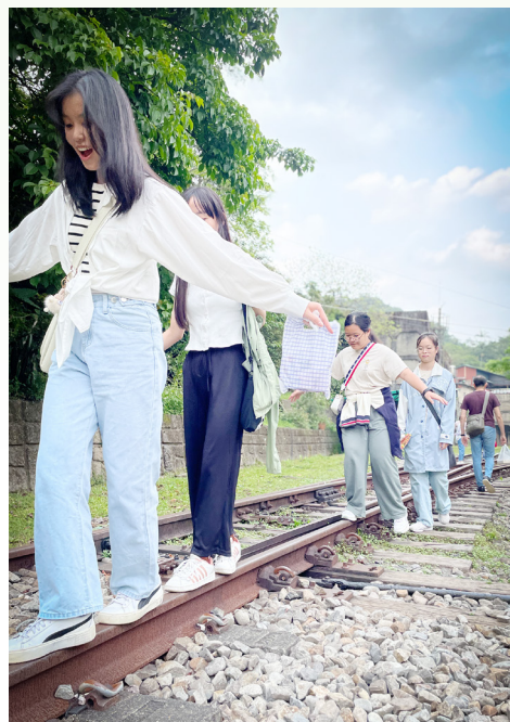
同學們在美麗而且滿載歷史文化的菁桐流連忘返