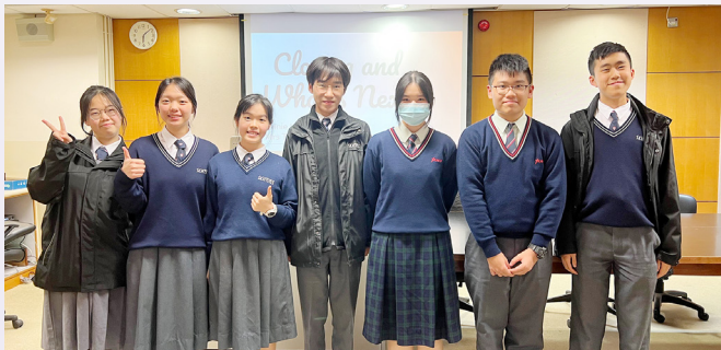
Attending SKH Tsang Shiu Tim Secondary School's YLP Event

“Declining... This is your Waterloo.” This sentence was whirling in my head. I couldn't deal with the shock and lamentation of my failure. What if I will never get awards ever again? What if I lost on my journey of pursuing dreams?