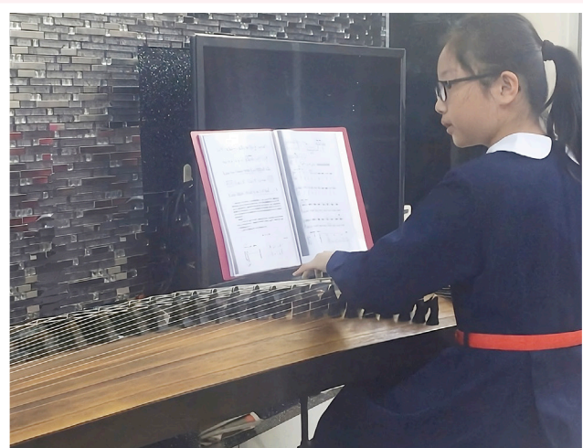
紫晴從小在家中勤練古箏