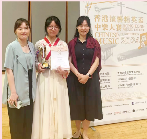
香港演藝精英杯大賽