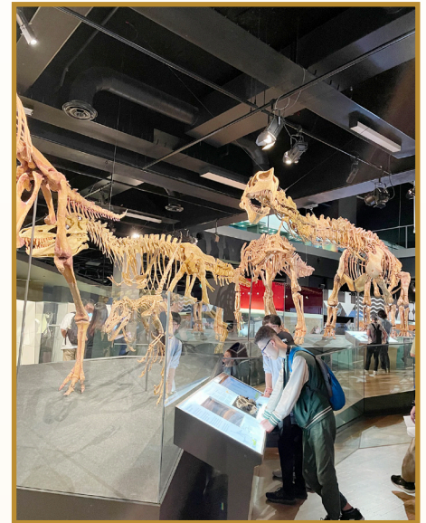
Learning about dinosaurs in Melbourne Museum

In this trip, I learned some Australian terminology and pronunciation. For example, breakfast is pronounced as Brekkie, Good day, mate is pronounced as G'day, mate (geh day, mate), etc. I was very impressed with taking classes with Australian students. In addition to learning in the classroom, I also made new friends. What an unforgettable experience!