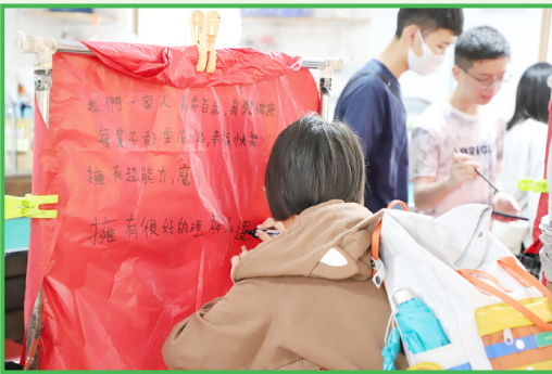
同學們各自在天燈上寫下屬於自己的願望

“古語云：「讀萬卷書，行萬里路」，這次台灣之旅讓我感受到旅行正是一種生動有趣的學習體驗。”