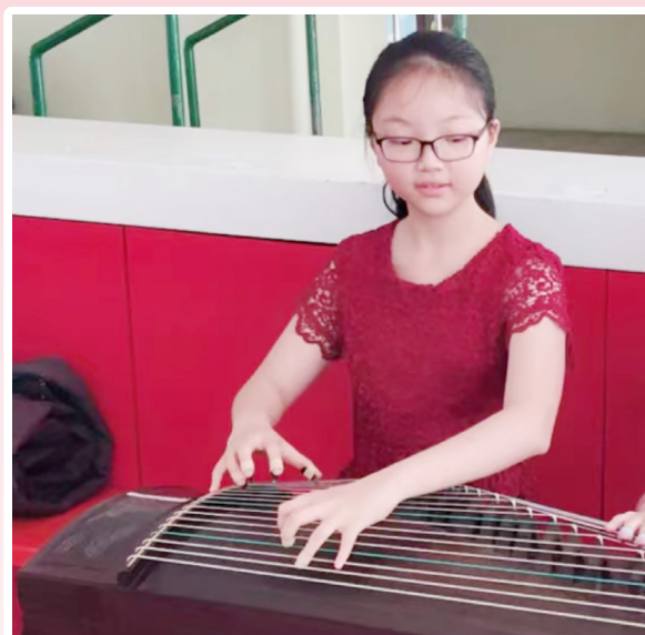
小六比賽預備現場

我 對古箏的接觸始於我小學二年級的時候。我第一次從媽媽手提電話中聽到古箏的音樂，我被它獨特的聲音所吸引，這激發了我對這個古老樂器的興趣。我十分好奇，抓住媽媽問個不停，媽媽也有意為我選擇一門樂器，就這樣順水推舟，我踏上了我的「箏道」，正式開始學習這門樂器。