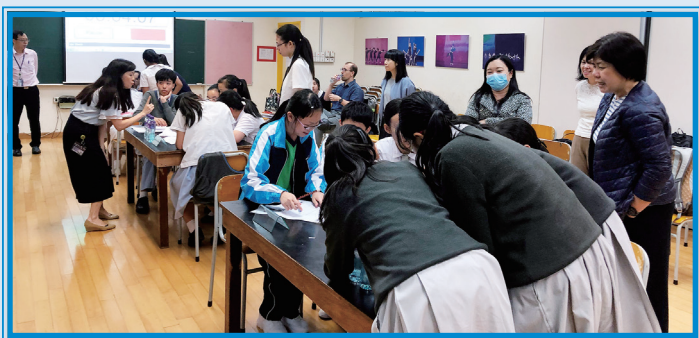
Students got five minutes to work on answers for Part 1

In Part 1, students needed to answer ten open-ended questions within five minutes. Short answers and minor grammatical mistakes that did not impede understanding were acceptable. Each correct answer scored 10 points. The maximum score teams were able to achieve in Part 1 was 100 points.