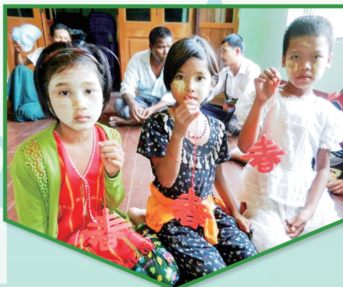
學童學習中國剪紙藝術

在這次的緬甸服務體驗團，我很高興有機會參與，更對旅程的一切感到深刻。起初，我以為緬甸的環境會非常差，