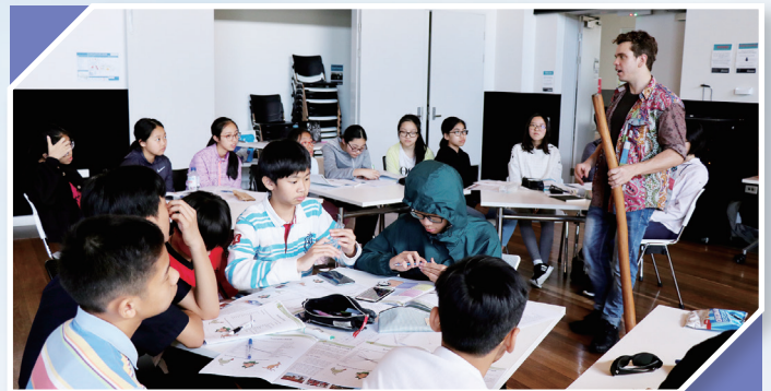
Learning about Australian culture

Overall, I enjoyed this trip to Australia very, very much, especially the warmth of the host family. I sincerely hope that the school can hold this type of study tour more frequently so as to provide us with a chance of improving our English. I've really gained a lot from this study tour.