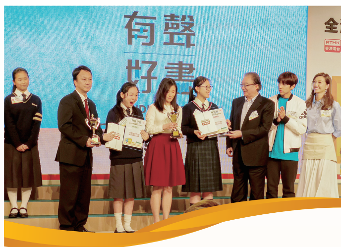
師生同在台上接受獎項，感到喜悅和興奮

甚至於後來聽聞與我同一比賽的他校學生也有為我投票，我不禁感深肺腑，給了她一個大大的熊抱。同時，我想在此感謝各位熟悉的人和陌生的人，再次感謝你們對我所有的支持。