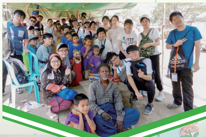
探訪德拉區由一位基督徒辦的孤兒院

緬甸國教是佛教，因此當地僧侶無處不在，由繁華的市區到落後的村莊都能找到。他們會捧著一個煲四處找人「化緣」，無論在任何地區，市區、村莊、貧民區的居民都樂意把金錢或食物送給前來化緣的僧侶。他們即使很貧窮仍願意分享自己所有。這種樂於分享的心在物質富裕地區是鮮有的，曾有研究指出樂於分享的心是與人的富裕程度成反比，即愈富有就愈吝嗇，在緬甸真的能印證這看似荒謬的理論，因為在德拉區仍能看見當地人給僧侶化緣，而身為基督徒的我，在教會奉獻時，很多時即使有錢也不太願意奉獻，因此，這趟緬甸之旅讓我反思到對信仰的態度，提醒我應有樂於分享的心。