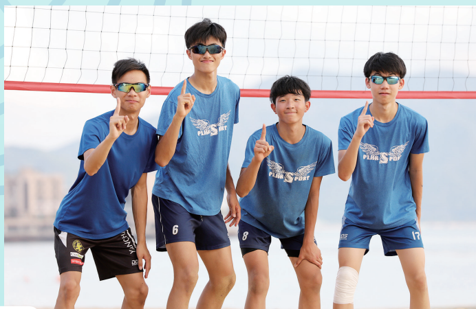
沙灘排球隊成員合攝

排球影響了我，也改變了我。它除了為我帶來今日的成就，還讓我學會了很多人生道理，修正了我的處事態度。不但如此，排球也讓我結識了一群好兄弟，還有很關心我們的教練，我們互相扶持，向前邁進。