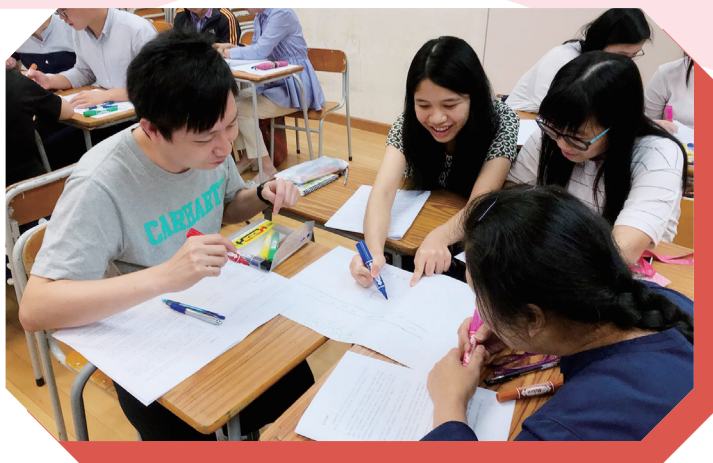
本校老師與校外老師就情境教學進行交流

戲劇活動是一種愉快的學習，不會太死板。通過多次的檢討和嘗試，班上的同學都能夠從不同角度來討論、判斷和擴闊自己的思考，提出自己的想法。