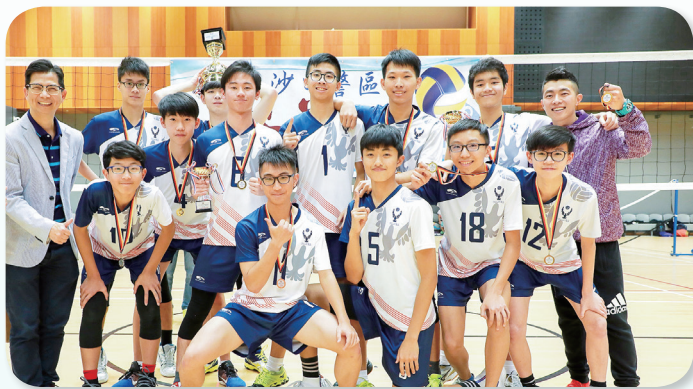
排球隊參與減罪盃冠軍 2018

不要以為這樣的關係得來容易，光中男子排球隊在這兩三年間曾處於低谷，隊友們出現互相嫌棄、意見分歧的時候，甚至常缺席練習，結果排球隊表現理所當然的一塌糊塗。今年，可以用脫胎換骨來形容球隊，各位隊員痛定思痛，大家重整軍心，互相包容接納，我們全隊上下一心鎖定目標，期望以更好的成績進軍全港學界精英排球比賽。經過一番努力，最終我們成功奪得光中失落了七年的精英賽的資格。來年我會擔任排球隊甲組隊長一職，我必定竭盡所能，帶領球隊奪得佳績，為學校爭光，希望大家能繼續支持我們。