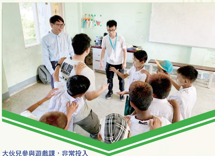
大伙兒參與遊戲課，非常投入

甚至可能是我無法接受的程度，但整體感覺卻意外地好，我認為緬甸雖是炎熱但不算太骯髒。另外，在整個體驗當中，我能深深體會到當地人的生活是多麼簡樸而又快樂，特別是當地小朋友。我們在當地學校教導他們英語，過程雖有些言語不通的問題，但我們通過身體語言及眼神互相交流。而且，從他們的眼神能感受他們真心的快樂。最後，我希望再有類似的機會去體驗更多不同國家的特色。