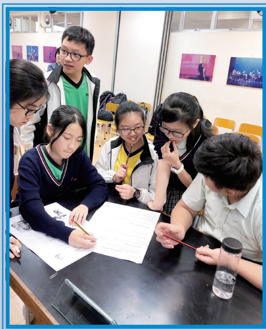
PLHKS Team was racking their brains

I realized that winning is not that important. The contest was held to foster our interest in reading, not just for victory. The essential part is enjoying the process of the contest.