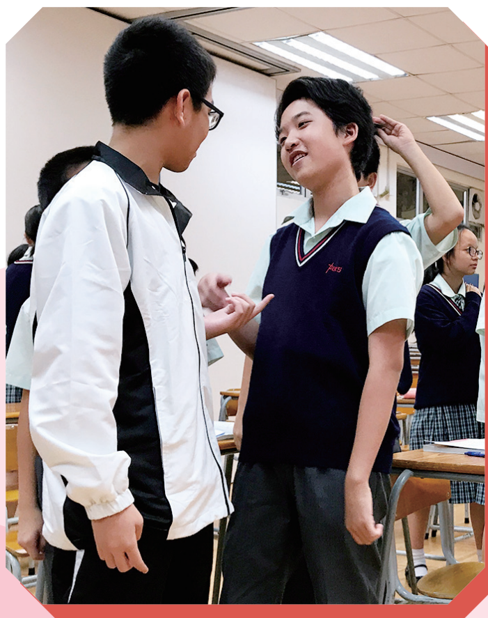
同學於課堂上的情境創作

戲劇教學法讓我們在學習中文的同時，還漸漸培養我們的戲劇演繹能力，把自己帶入文章中，成為當中的一員，使自己閱讀文章時能更好地理解文章立意。