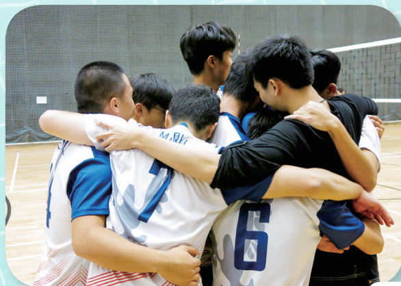
經過多場比賽，隊員越發團結一致