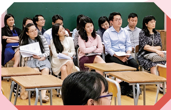
老師們參觀本校的示範課

我認為令我印象最深刻的是《狂泉》，老師讓我們代入國君的角色作選擇，她搜集了很多關於人民治療國君的圖片，例如喝中藥、針灸、以蜈蚣入藥、開顱等，看到治療的恐怖程度層層遞進，我們的選擇也從一開始的各有不同變成意見一致，幾乎全都受不了折磨而選擇喝下使人瘋狂的泉水，令我們更加理解故事中國君無法堅持的原因。戲