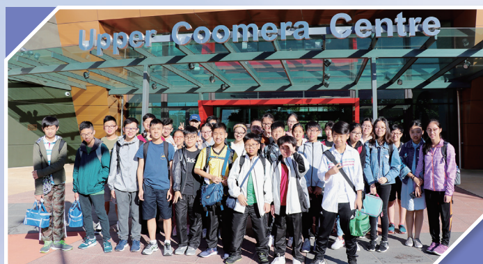
We had some good time in an Australian community centre

Looking back at the tour, we are grateful for two things: 1) the good weather and 2) the good people we met. During our stay in Australia, we enjoyed many sunny days! With the assistance of their buddies at Livingstone Christian College, our students were able to make some Australian friends at school.