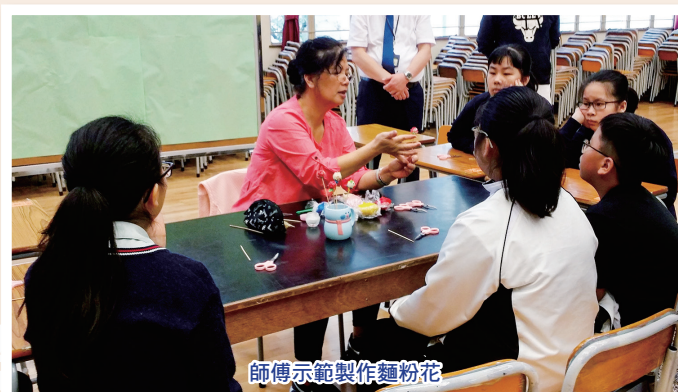
師傅示範製作麵粉花

不過很可惜，由於我去的時間比較晚，所以未能學習繩結和剪紙，希望以後還有機會學習吧！這次的活動讓我明白了累積的經驗越豐富，做起事情來就越得心應手。所以我們要反復練習，做起那件事就越容易、熟練。