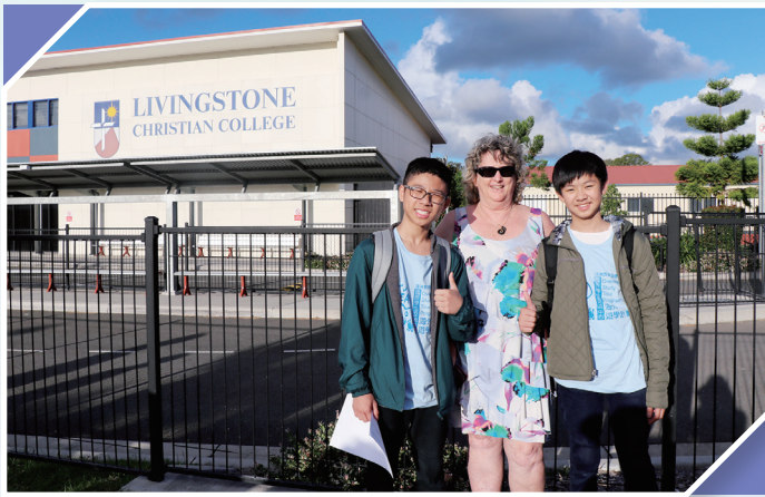
Our homestay mum drove us to school