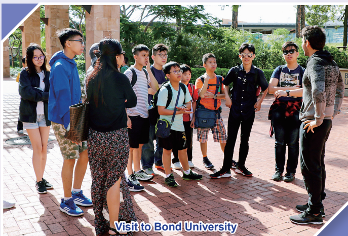
Visit to Bond University