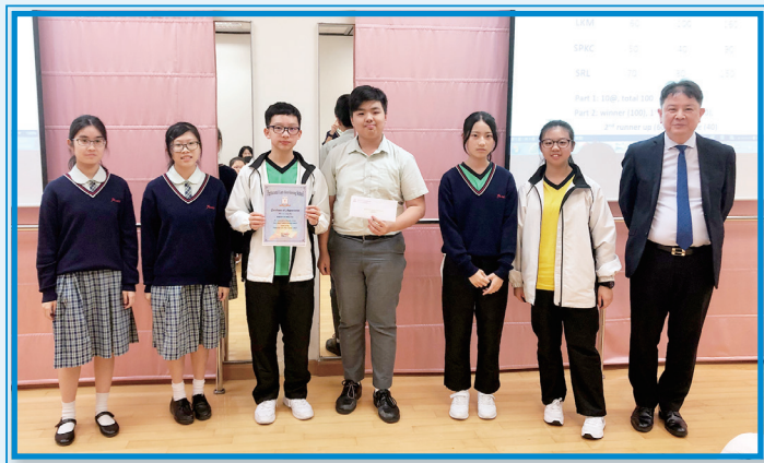
We got the second runner up

I have really gained a lot in the experience of the English Reading Competition. Not only have I matured from the books that I read, but I have also learnt from my fellow teammates.