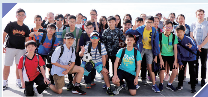
Happy faces at Gold Coast