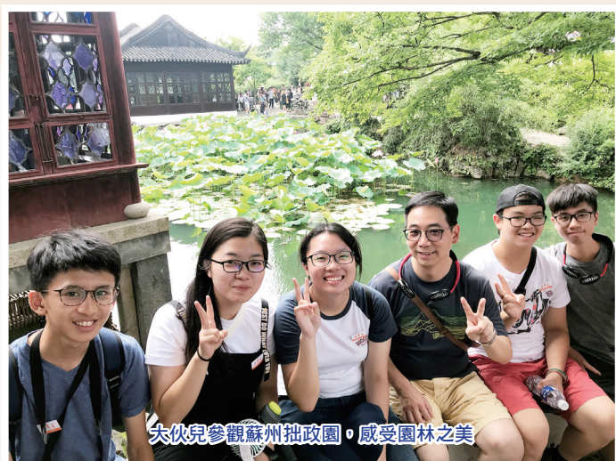
大伙兒參觀蘇州拙政園，感受園林之美

另外，我們在山塘古街逛了逛，裡面的建築現在已多發展為商店，使舊式建築和現代商店融為一體。這樣雖然會丟失了一些傳統風貌，但是為了活化歷史建築，這也不失為一個好辦法。在山塘古街的茶室一邊品茗，一邊欣賞評彈，蘇州人有時在這些店一坐就是一個下午，悠閒自在，也令我感受到蘇州與香港截然不同的生活節奏。