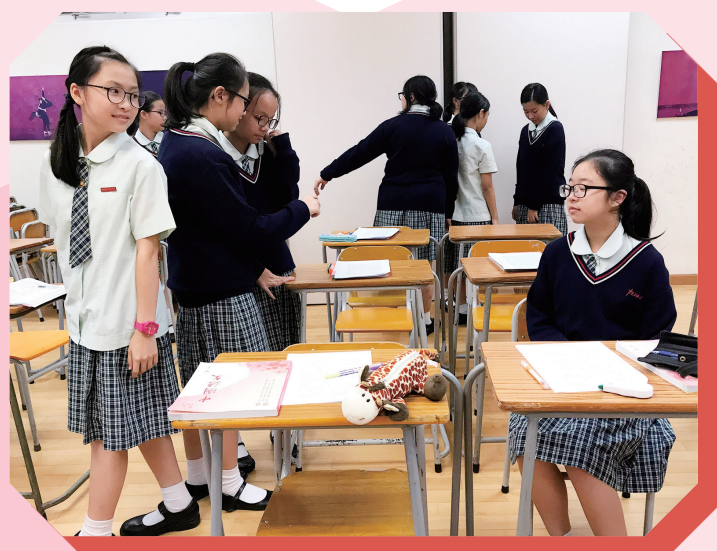
戲劇教學活動——定格創作

戲劇活動是以一種輕鬆、自由的形式進行，有別於平日緊繃的學習模式，我們能盡情投入課堂，思考能力有所提升。