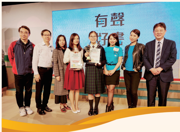
領獎後大伙兒合照留念

若你不曉得作者背後想表達的情緒，你的腦海只會浮現很多、很多的大雁，在你面前飛過而已，因此朗誦需配合的是對文學的理解，再以各種身體語言演繹出來。